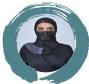
الرئيسة الفخرية صاحبة السمو الملكي الأميرة فهدة بنت فهد آل سعود