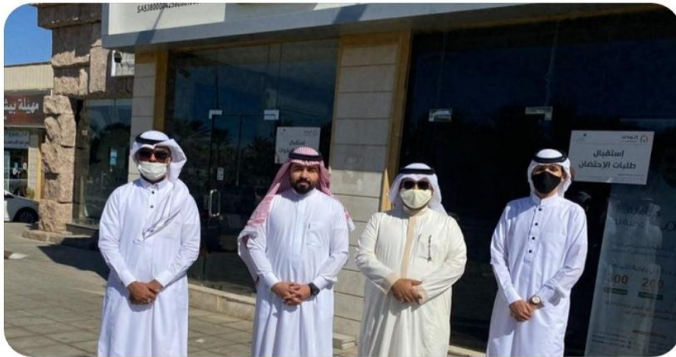
وسم المدينة و٩ آخرون