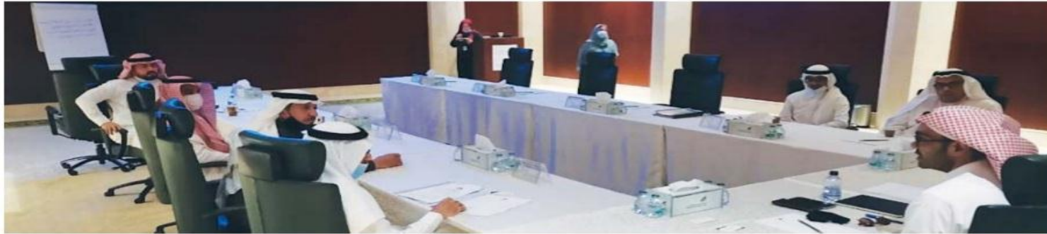
جانب من ورش عمل الجمعية

لتحقيق إستراتيجية المملكة للمسؤولية الاجتماعية للشركات وتحقيق الاستدامة للشركات وفق أهداف التنمية المستدامة وأوضح المقنص أن العمل يجري مع الشركات لإصدار الاستدامة وتحقيق المسؤولية الاجتماعية بأبعادها الثلاثة بيئياً واجتماعياً واقتصادياً وتعزيز وتمكين التطوع الاحترافي والمهاري من خلال خلق الفرص التي تناسب المتطوعين في جميع المجالات وتسخيرها للقطاع العام وغير الربحي.