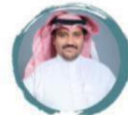
الرئيس التنفيذي عبدالعزیز بن محمد المقنص